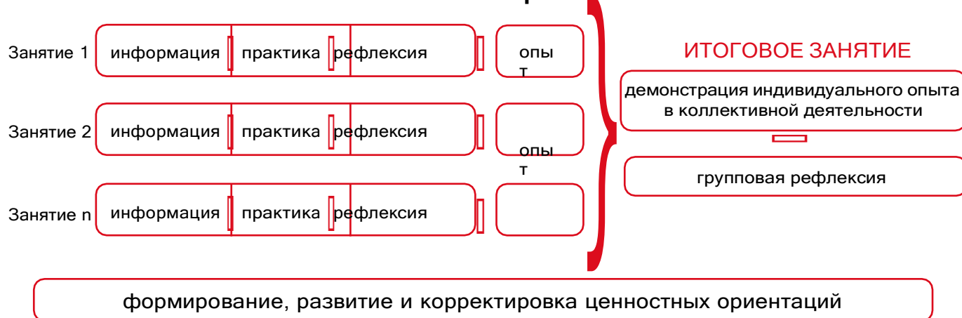
Рисунок 1 — Схема организации события

Таким образом, у пятиклассников происходит построение логической цепочки от собственного опыта проживания каждого занятия к ознакомлению с опытом других детей и к формированию общего отношения классного коллектива к прожитому ими событию.